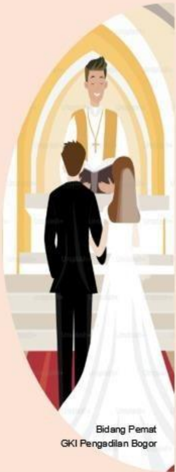
Bidang Pemat GKI Pengadilan Bogor